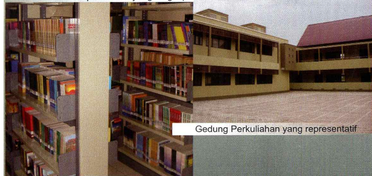
Gedung Perkuliahan yang representatif